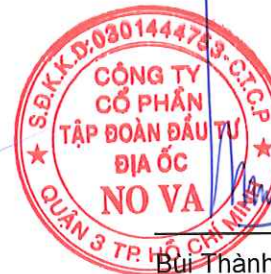
Bùi Thành Nhơn Chủ tịch Hội đồng Quản trị