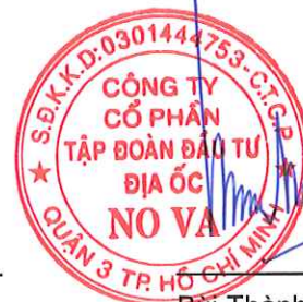
Bùi Thành Nhơn Chủ tịch Hội đồng Quản trị Ngày 10 tháng 3 năm 2017

Các thuyết minh từ trang 11 đến trang 80 là một phần cấu thành báo cáo tài chính hợp nhất này.